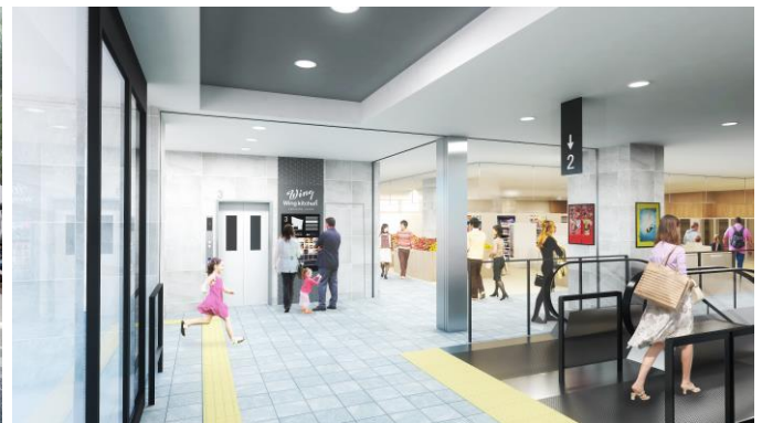
ウイングキッチン金沢八景内観（3階）